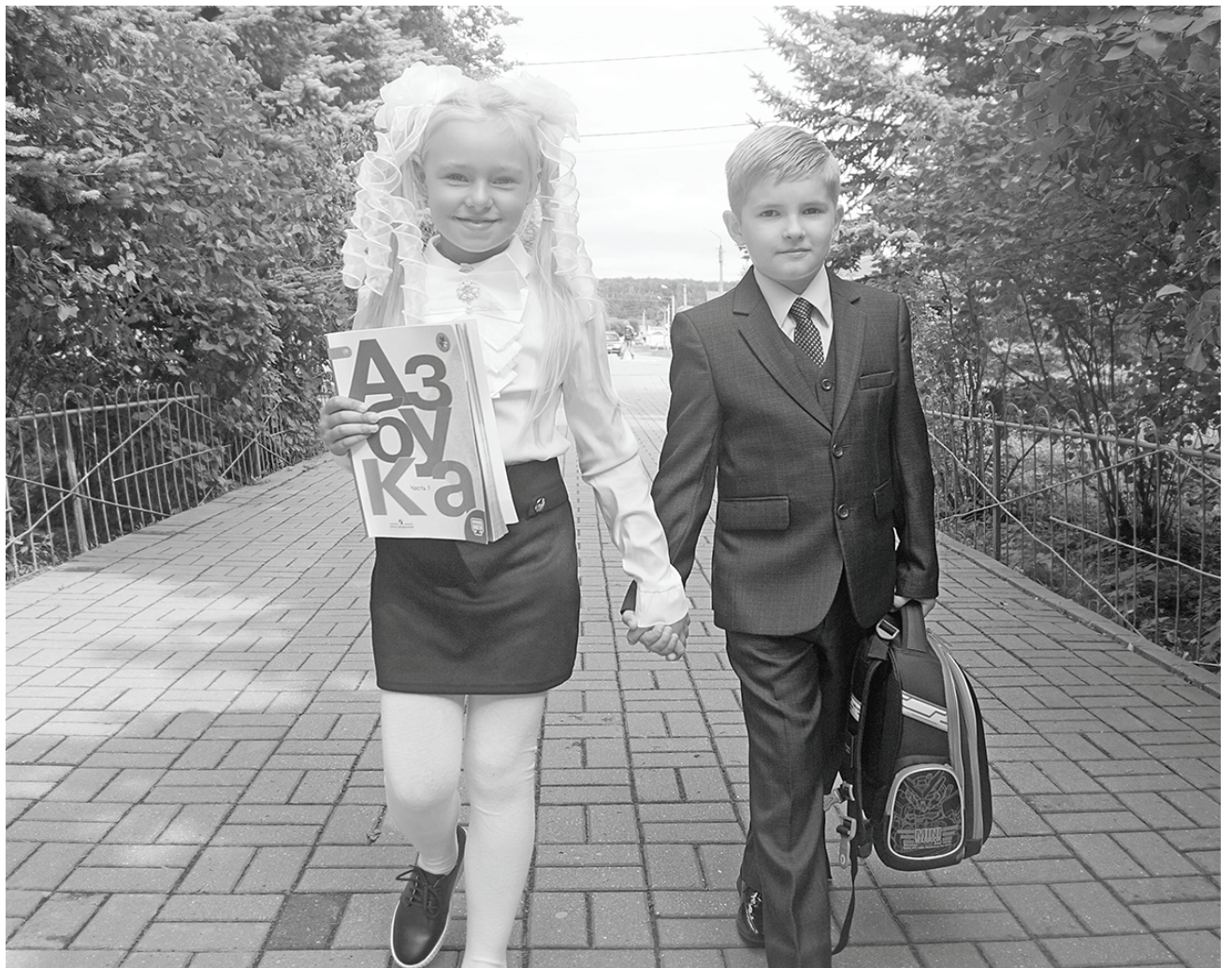
На пороге нового мира. Первоклассники-2017.